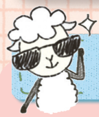
그림 속으로 고고씹~

“내가 너희에게 하는 이 말은 ○○ ○○에게 하는 말이다. ○○ 있어라.” (마르 13,37)